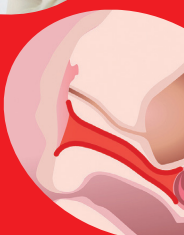
Dopo il trattamento IntimaLase